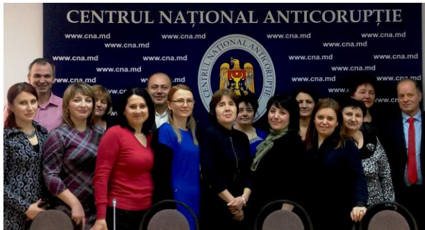
Cadrele didactice – promotori ai educației anticorupție