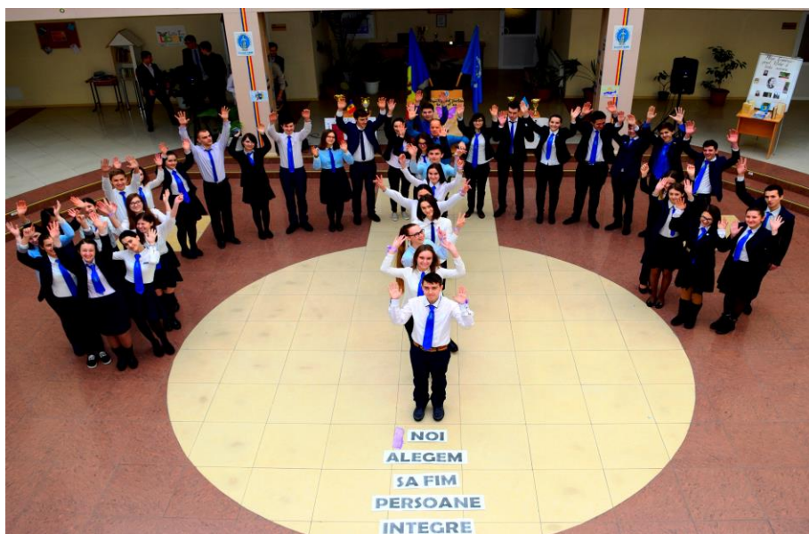
Persoanele integre asigură viitorul.

Astfel, prevenirea și combaterea corupției (ca și fenomen social negativ) contribuie la consolidarea democrației, la creșterea veniturilor cetățenilor, la îmbunătățirea serviciilor publice, la stimularea încrederii și participării active a cetățenilor, în ultimă instanță, la soluționarea problemelor comunității. Lupta împotriva corupției, în cazul în care este gestionată corect, poate deveni o pârgie în realizarea unor obiective mult mai ambițioase, nu doar a celor legate de supraviețuirea financiară, ci și a celor ce se referă la consolidarea relațiilor dintre cetățeni și administrațiile locale sau centrale.