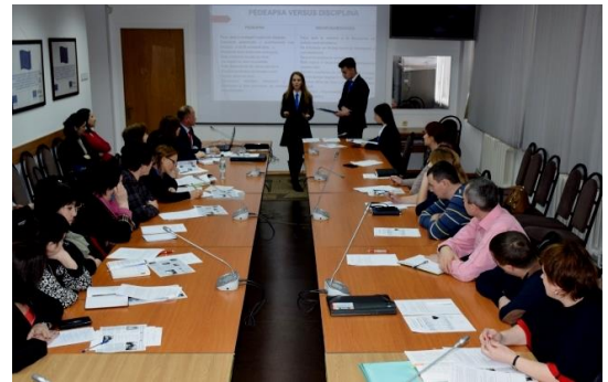
Dezbateri: integritate versus corupție

Determină domeniile din societate pe care le percepi ca cele mai corupte. În ce măsură cetățenii ar putea contribui la prevenirea actelor de corupție? Propune 2-3 măsuri/acțiuni de combatere a corupției.